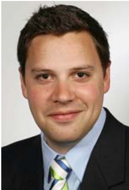
Von Thomas Rühl Credit Suisse Economic Research Zürich

Der Grossraum Bern mit dem Städtedreieck Bern-Burgdorf-Thun zählt zu den fünf grossen Wirtschaftsräumen der Schweiz. Das Qualifikationsniveau der Arbeitskräfte und die gute Erreichbarkeit sind die Standorttrümpfe dieses Raums und sichern ihm einen Platz weit oben auf der Rangliste der Standortqualität. Trotz der Standortstärke seiner Zentrumsregion vermag der Kanton Bern jedoch kaum Impulse über die Kantons Grenzen hinaus zu senden. Der im Grossraum Bern omnipräsente öffentliche Sektor schafft zwar viele Arbeitsplätze, löst ansonsten aber kaum Wachstumsprozesse aus.